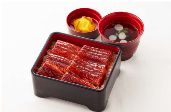
うなぎ二倍盛り重(お吸い物・漬物付) 価格: ¥1,599(税込 ¥1,758)

販売期間 : 2023年4月18日(火)15時 ~ 対象店舗 : ジョイフル全店(一部店舗除く)※