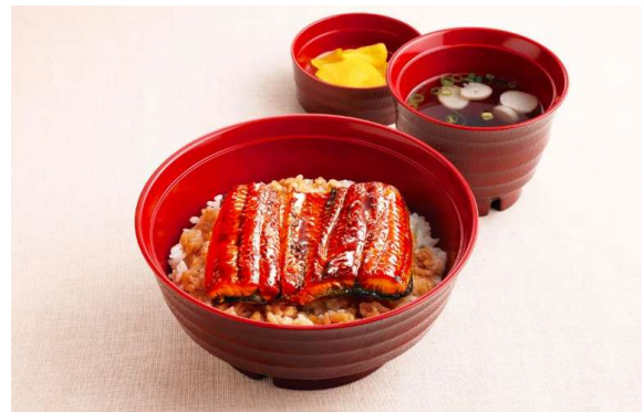
うなぎ丼(お吸い物・漬物付) 価格: ¥999(税込 ¥1,098)